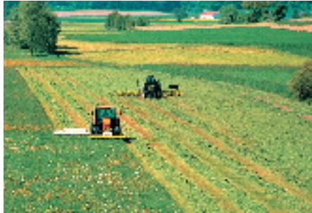
Zur Verkürzung der Feldliegezeit sollte der Mäh-schwad gleich anschließend nach dem Mähen breit gestreut werden

ballenpressen. Damit die Ballen auch in den Randbereichen ausreichend verfestigt werden, sollte die Schwadform möglichst kastenförmig mit leichter Erhöhung an den Kanten ausgeformt sein.