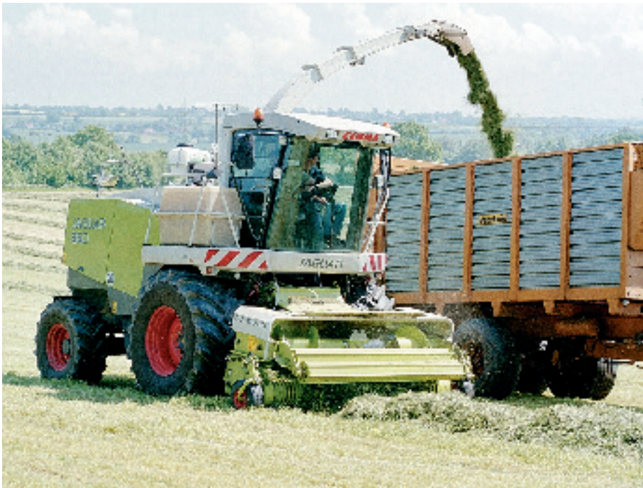
Der Exakthäcksler bietet mehrere Orte der gleichmäßigen Einbringung von Silierzusätzen. Besonders interessant ist die „ultra-low-volume-Dosierung“ für Milchsäurebakterienimpfkulturen, da Aufwandmengen < 250 ml/t FM ausreichen. Es braucht nur einmal pro Tag nachgetankt zu werden.

kann unter www.lwk-sh.de/Fachinfo/Pflanzenbau/Futterkonservierung oder unter www.guetezeichen.de mit Herstelleradressen abgerufen werden.