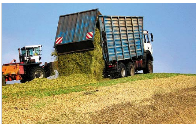
Lkws mit Allradantrieb erlauben auch bei größeren Steigungen eine Befüllung mit Überfahren.

Im Zeitraum vom Sommer 2003 bis zum Frühjahr 2005 wurden 211 Praxisilagen hinsichtlich ihrer Verdichtung untersucht (Übersicht 3). In