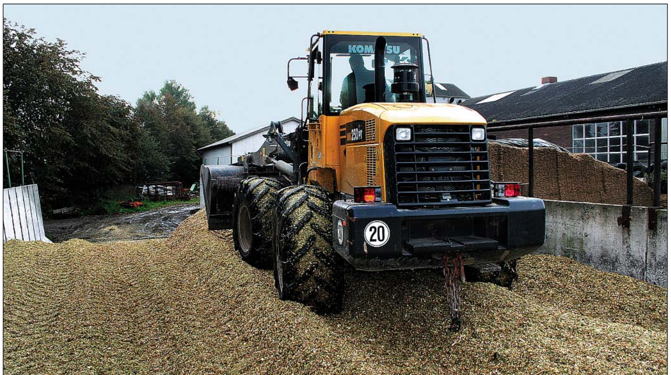
Radlader eignen sich gut für den Transport und die Verteilung des Siliergutes bei Silomais.

Für Siloplatzen hat sich der Einsatz von Raupenbaggern zur Optimierung der Kantearbeit, zum Seiten-