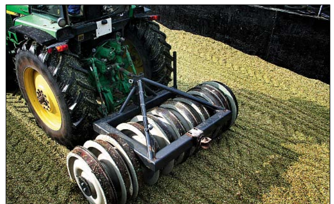
Spezielsilo-Walzen ermöglichen eine Steigerung der Verdichtung um bis zu 10 Prozent und sind daher besonders bei Fahrsilos mit Seitenwänden einsetzbar.